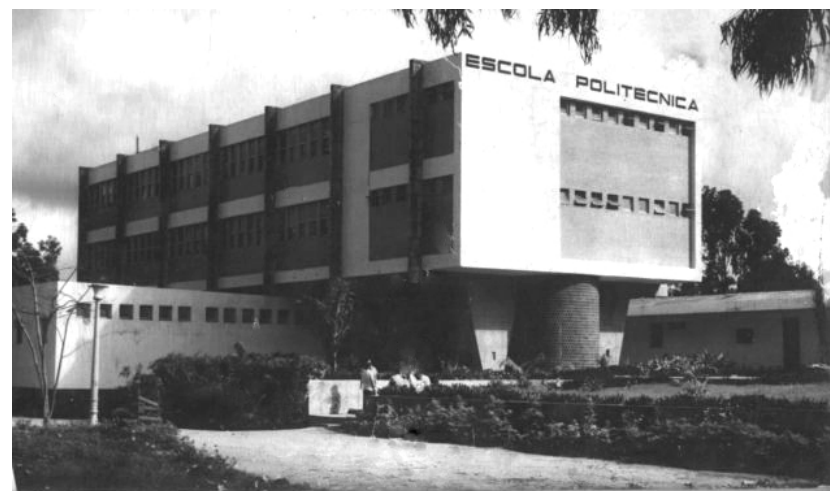
FIGURA 2 - PRÉDIO DA SEDE DEFINITIVA DA ESCOLA POLITÉCNICA