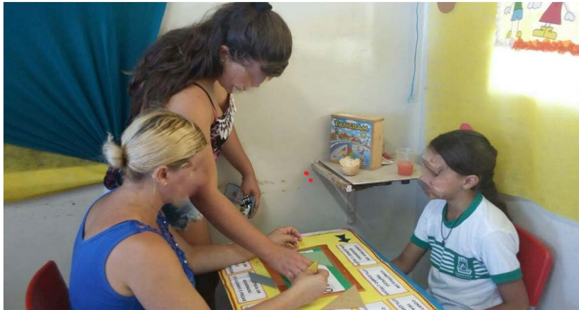
FIGURA 1– JOGO TANGRAM