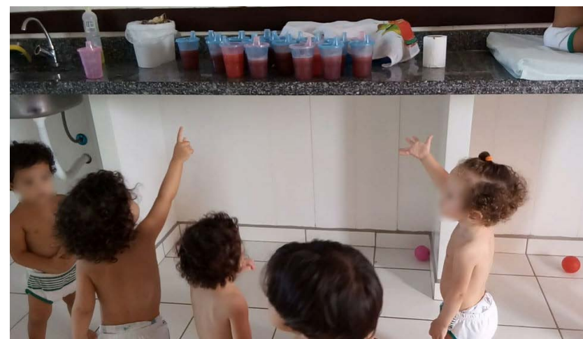
FIGURA 4 - ME DÁ MEU LANCHE