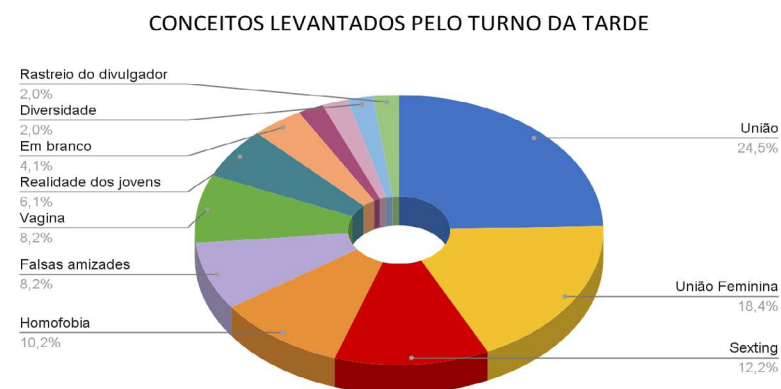
GRÁFICO 2 – ASPECTOS IMPORTANTES APONTADOS PELAS/OS ALUNAS/OS NO TURNO DA TARDE SOBRE O QUINTO EPISÓDIO DA SÉRIE SEX EDUCATION (NETFLIX, 2019):